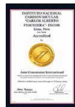
Reconocimientos 2020 JCI

para todos los establecimientos de salud a nivel nacional. El INCOR está en constante búsqueda por satisfacer plenamente las necesidades de sus pacientes cardíacos, y para ello, se viene planificando nuevas estrategias a fin de integrar en este modelo de salud de excelencia, el Sistema Nacional de Cuidado Cardiovascular. Somos conscientes de los retos que nos esperan, por ello, el INCOR reafirma su compromiso con sus pacientes y sus colaboradores. ■