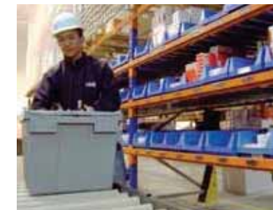
Seguridad y calidad