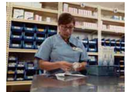
Garantía de abastecimiento permanente