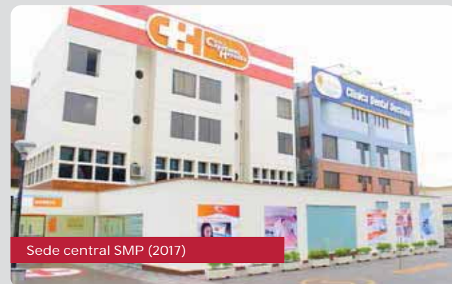
Sede central SMP (2017)

Las instalaciones de la CMCH están implementadas con modernos equipos de diagnóstico por imágenes digital, los cuales, sumados al reconocimiento profesional de su staff médico conformado por 350 médicos de más de 50 especialidades y subespecialidades, aseguran una atención de primer nivel.