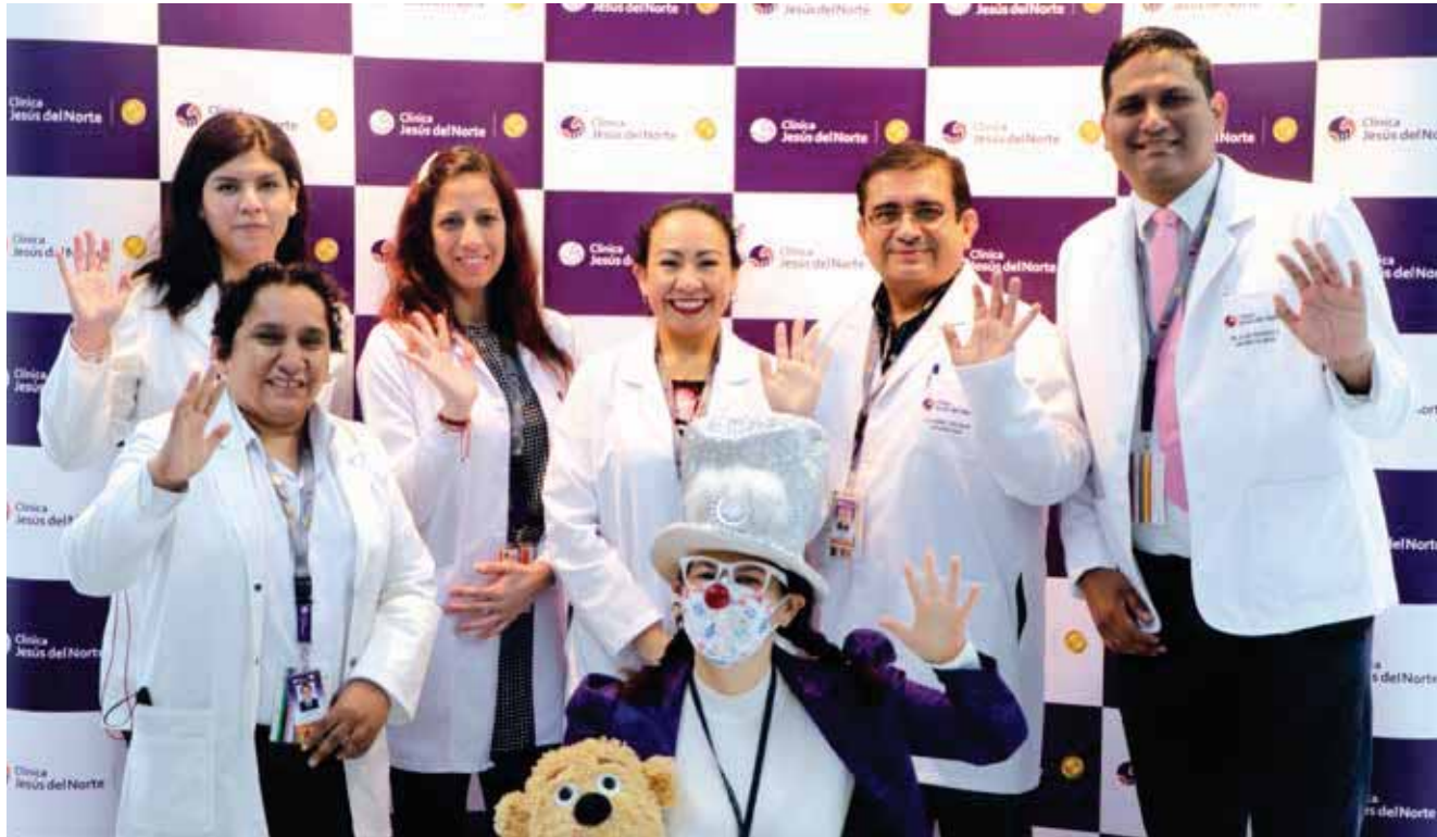
Personal médico y dirección médica de la Clínica Jesús del Norte.

Clínica Jesús del Norte inaugura nueva sala de operaciones y presenta dos renovados espacios hospitalarios