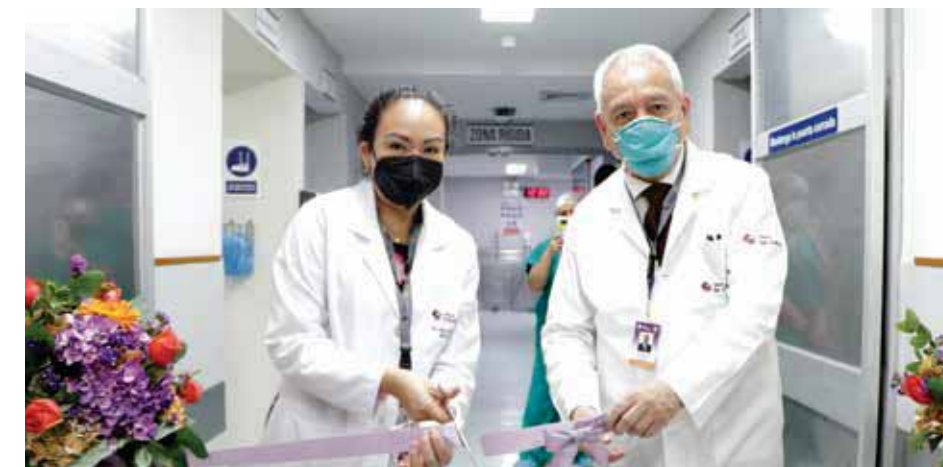
Personal médico y dirección médica de la Clínica Jesús del Norte.

Cada piso contará con personal asistencial profesional altamente calificado, como tres licenciadas en enfermería, dos técnicas y un médico tratante por cada paciente, lo cual permitirá continuar brindando una atención de calidad y tener una mayor eficacia durante todo el proceso, desde la evaluación hasta la emisión de resultados y tratamiento, a fin de optimizar la recuperación de sus pacientes. “El piso de hospitalización materna está acondicionado para nuestras futuras mamás. Las habitaciones son