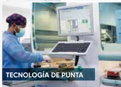
TECNOLOGÍA DE PUNTA