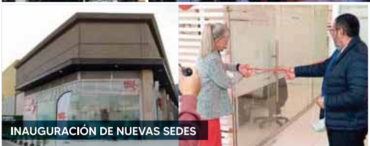
INAUGURACIÓN DE NUEVAS SEDES