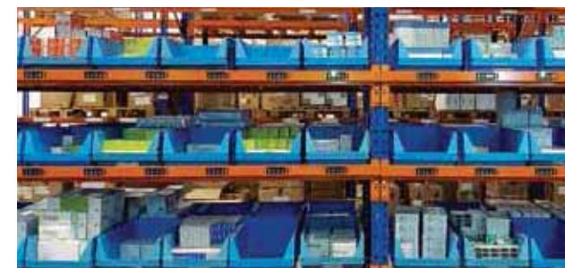
Venta de medicamentos e insumos y servicio de droguería para externos