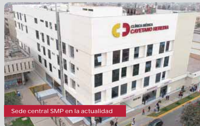
Sede central SMP en la actualidad