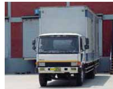
Reparto a domicilio

GESTIONAMOS CADENAS DE SUMINISTRO BASADOS EN MÁXIMAS DE CALIDAD, SEGURIDAD Y EFICIENCIA