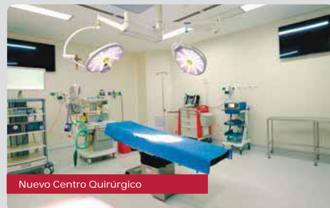
Nuevo Centro Quirúrgico