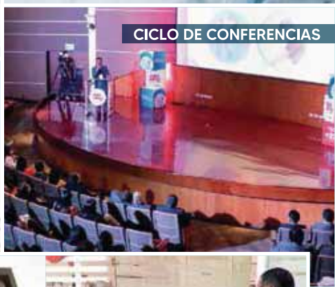
CICLO DE CONFERENCIAS