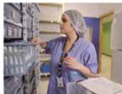
Garantía de abastecimiento permanente