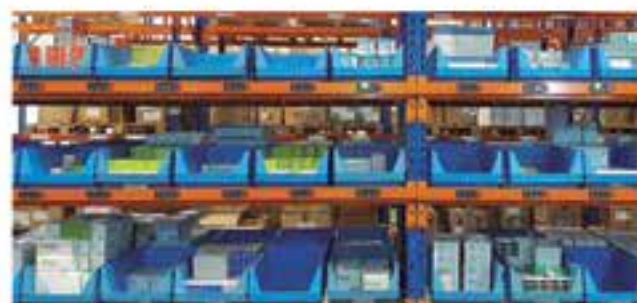
Venta de medicamentos e insumos y servicio de droguería para externos