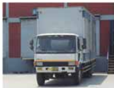
Reparto a domicilio

GESTIONAMOS CADENAS DE SUMINISTRO BASADOS EN MÁXIMAS DE CALIDAD, SEGURIDAD Y EFICIENCIA