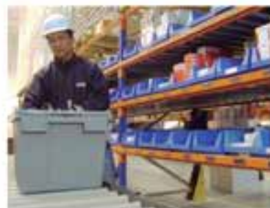
Seguridad y calidad