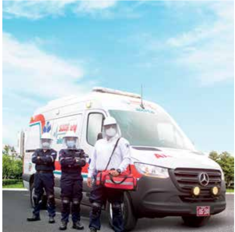
AMBULANCIA TPO 3 – PARA TRASLADO DE PACIENTES COVID